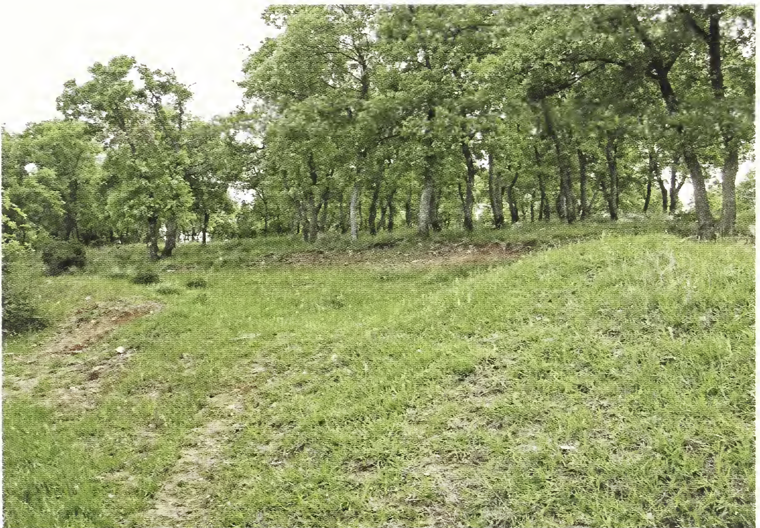
Fig. 10 - Habitat di (of) Dorcadion ariannae , presso (near) Petrohori, nom. Xanthi.

In un nostro recente contributo (Pesarini & Sabbadini, 2007: 62) avevamo messo in rilievo alcune differenze riscontrate fra il materiale da noi esaminato di D. tuleskovi Heyrovsky, 1937 e l'olotipo di D. olympicola Heyrovsky, 1941, avanzando peraltro riserve sull'effettiva distinzione, a livello specifico, dei due taxa, descritti entrambi del Monte Olimpo. L'esame di ulteriore materiale, pur se anch'esso non abbondante, ha evidenziato che le differenze riscontrate, anziché essere dovute ad